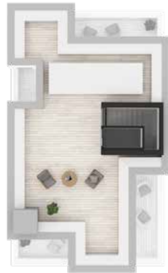
Terraço / Terrasse / Terrace