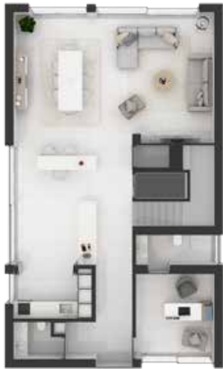
Térreo / Rez-de-chaussée / Grounfloor